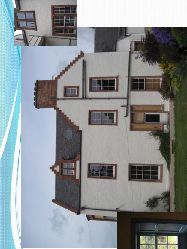
Laidlawstiel House, Galashiels – Scotland