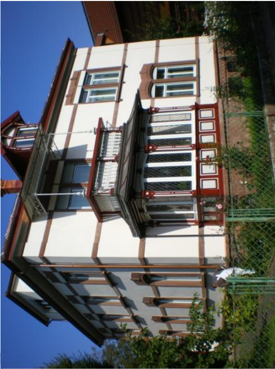
Poststrasse Wertheim am Main