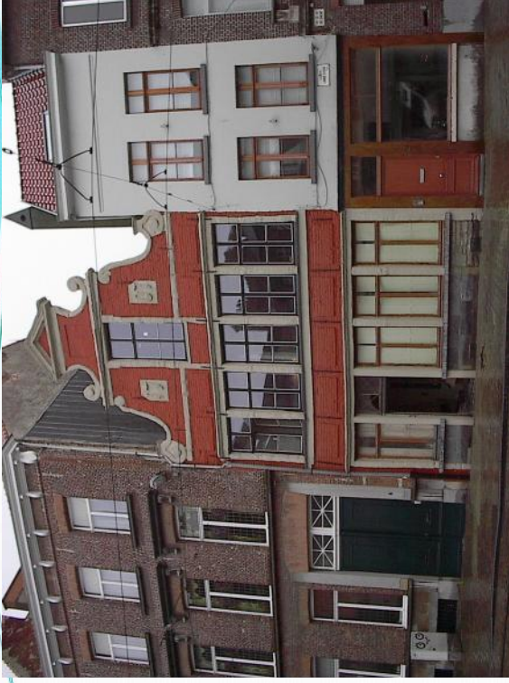
Lange Steenstraat 4, Gent (B)