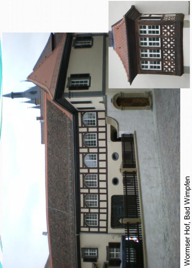
Wormser Hof, Bad Wimpfen