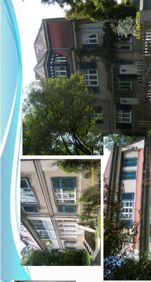
Villa in Gaunting