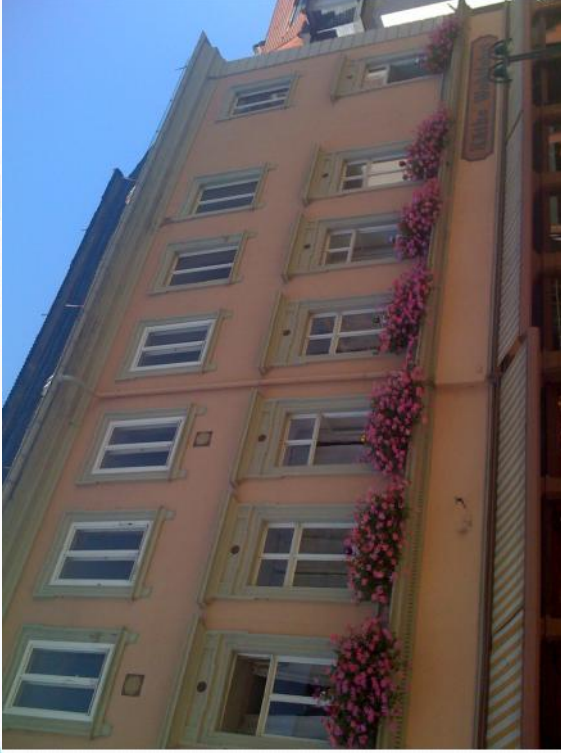
Hauptstrasse 124, Heidelberg