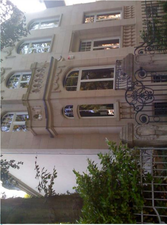
Villa in Offenbach