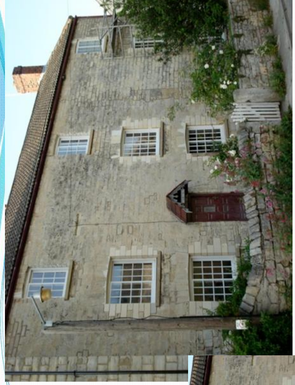
White Rose Mill, Saxton - England