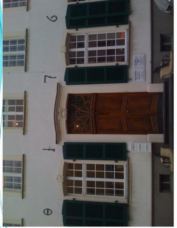
Hauptstraße in Bergheim, Stadtvilla