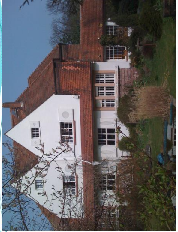
Villa in Dreieich-Buchschlag