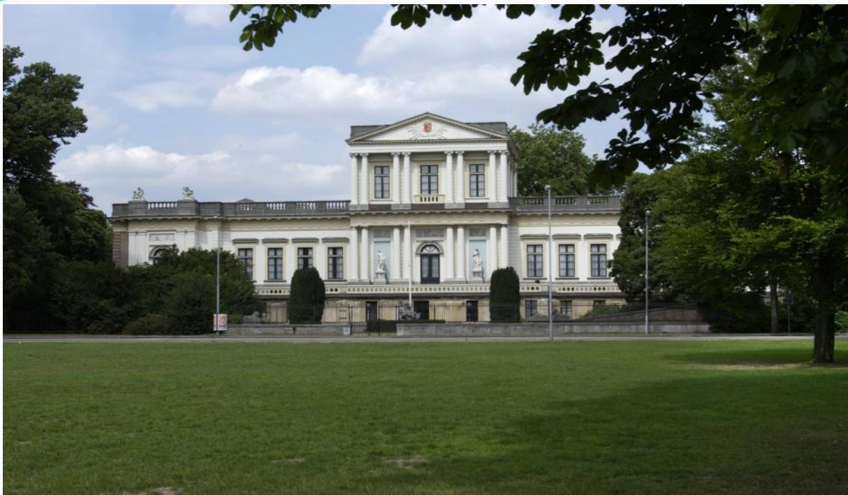
Paviljoen Welgelegen, Netherlands

Nachfolgend sehen sie einige Projekte in Bildern und eine Liste der Referenzen.