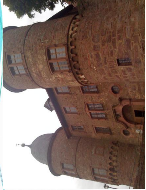
Torturm Burg Wertheim

Ein Beispiel für den äußerst auffallenden Unterschied zwischen restituierten Originalfenstern im Erdgeschoß mit Histoglas Typ 10 und modernen Standardfenstern von 1970 im ersten Obergeschoß – ohne Rücksicht auf die historische Gestaltung