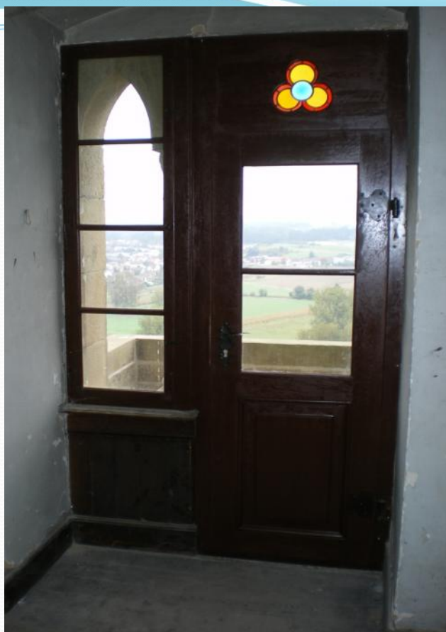
Wormser Hof Bad Wimpfen

La chronologie et les détails de montage indiqués ci-dessus doivent être documentés pour pouvoir garantir la fonctionnalité de l'ensemble du système (par exemple, moment du revêtement de la 1ère + 2ème couche de vernis sur le mastic).