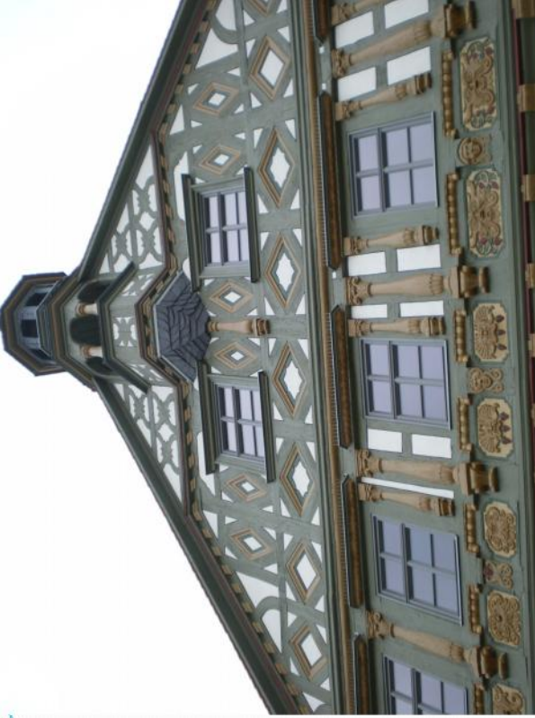
Hôtel de ville Burgkunstadt