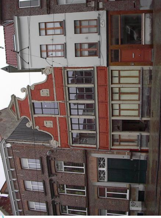
Lange Steenstraat 4, Gent (B)