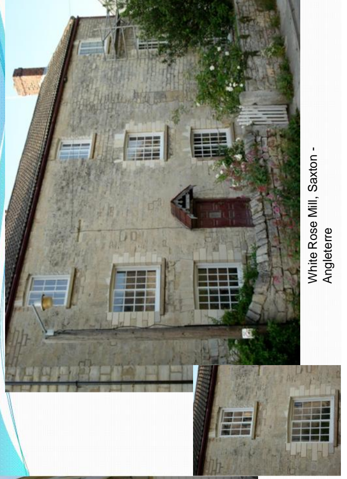
White Rose Mill, Saxton - Angleterre