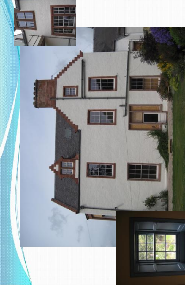
Laidlawstiel House, Galashiels – Écosse