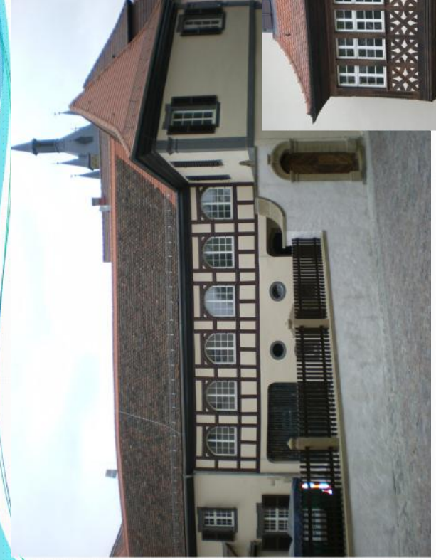
Wormser Hof, Bad Wimpfen