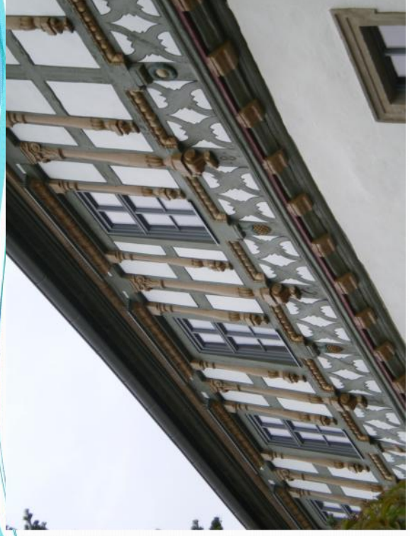
Hôtel de ville Burgkunstadt