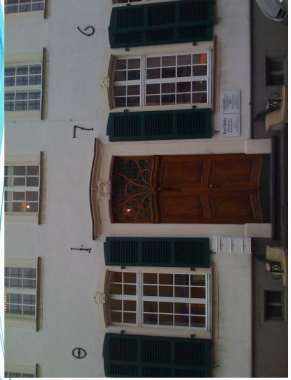
Hauptstraße in Bergheim, Stadtvilla