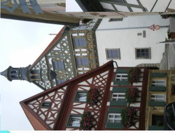
Hôtel de ville Burgkunstadt